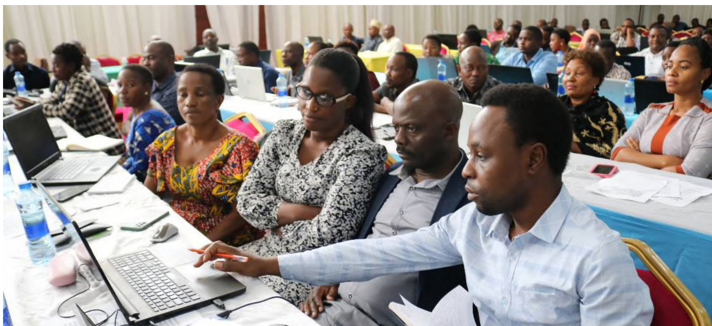
Washiriki wa mafunzo ya Mfumo mpya wa Taarifa za Kiutumishi na Mishahara (HCMIS) yaliyofanyika tarehe 4 – 6 Julai, 2023 jijini Dodoma wakisikiliza hotuba ya Waziri wa Nchi (Ofisi ya Rais) Menejimenti ya Utumishi wa Umma, George Simbachawene wakati wa kufunga mafunzo hayo.