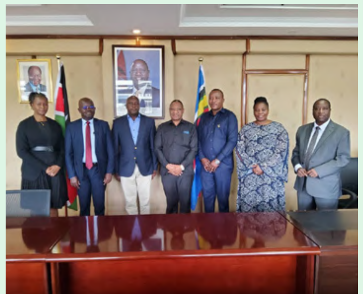
Picha ya pamoja kati ya timu ya wataalamu wa masuala ya elimu kutoka Tanzania waliofanya ziara nchini Kenya pamoja na wataalamu wa masuala ya usimamizi wa elimu wa Kenya.