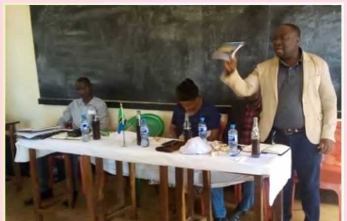
Kikao kazi cha Tume ya Utumishi wa Walimu (TSC) Wilaya ya Kakonko na walimu wa kutoka shule za Kata ya Rugenge kikiwa kinaendelea.