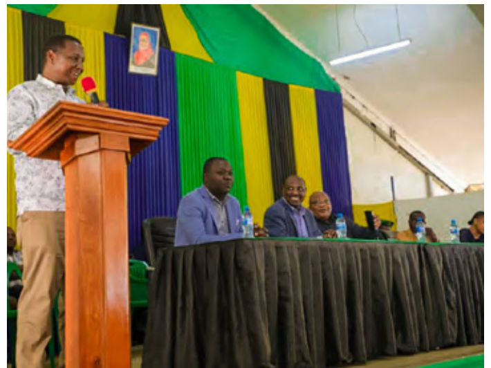
Waziri wa Elimu, Sayansi na Teknolojia, Profesa Adolf Mkenda akizungumza wakati wa ufunguzi wa mafunzo endelevu ya walimu kazini (Mewaka) kwa Maofisa Elimu Kata kutoka mikoa saba jijini Mwanza.