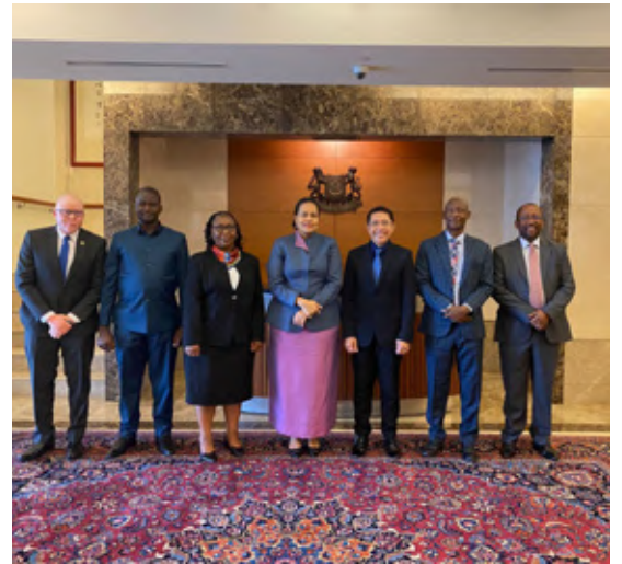
Waziri wa Nchi Ofisi ya Rais Tawala za Mikoa na Serikali za Mitaa (OR – TAMISEMI), Mhe. Angellah Jasmine Kairuki (katikati) akiwa katika picha ya pamoja na Waziri wa Mambo ya Nje na Elimu wa Singapore, Mhe. Dr. Mohamad Maliki Bin Osman (wa tatu kutoka kulia) pamoja na timu ya wataalamu wa elimu kutoka Tanzania wakati wa ziara ya Waziri Kairuki nchini Singapore iliyofanyika tarehe 24 – 29 Julai, 2023.