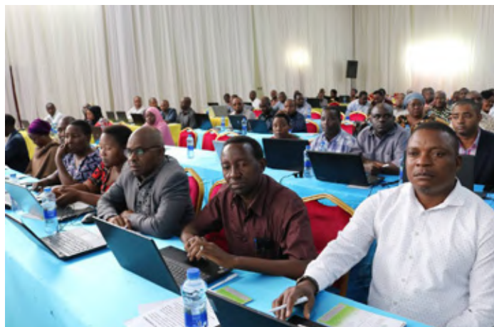
Washiriki wa mafunzo ya Mfumo wa Usimamizi wa Taarifa za Watumishi ujulikanao kama Human Capital Management Information System (HCMIS) yaliyowahusisha watumishi wa Tume ya Utumishi wa Walimu (TSC) ngazi ya Wilaya na Maafisa Utumishi kutoka Halmashauri zote nchini tarehe 05 Julai, 2023 jijini Dodoma wakikwa kwenye mafunzo.