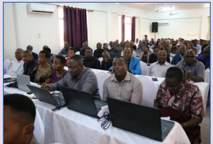
Washiriki wa mafunzo ya Usimamizi wa Mfumo wa Usiamizi wa Taarifa za Watumishi ujulikanao kwama Human Capital Information Management System (HCIMS) yaliyowahusisha watumishi wa Tume ya Utumishi wa Walimu (TSC) kutoka wilaya zote za Tanzania Bara wakiwa kwenye mafunzo.