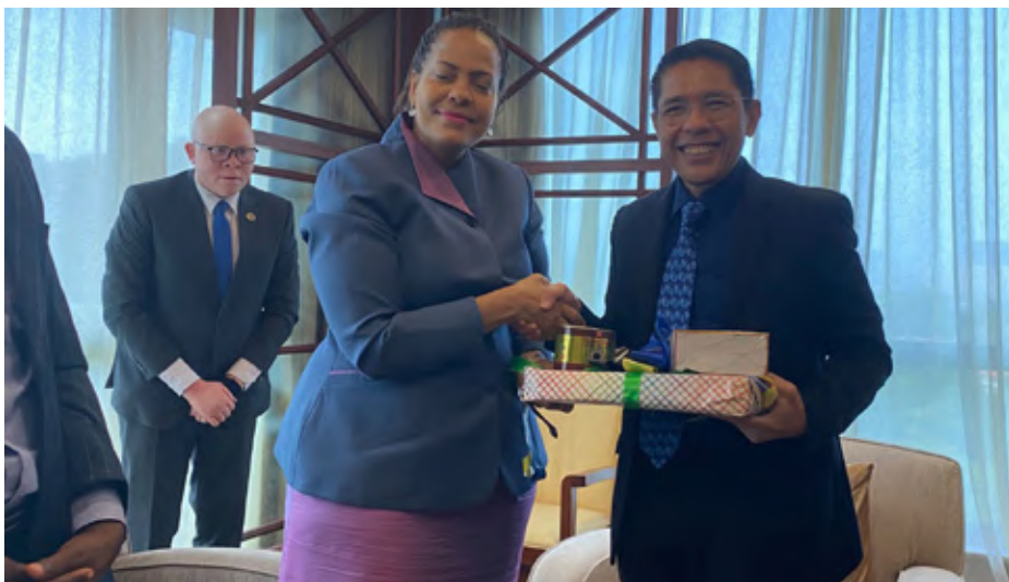
Waziri wa Nchi Ofisi ya Rais Tawala za Mikoa na Serikali za Mitaa (OR – TAMISEMI), Mhe. Angellah Jasmine Kairuki (kushoto) akiwa na Waziri wa Mambo ya Nje na Elimu wa Singapore, Mhe. Dr. Mohamad Maliki Bin Osman.

Taarifahiyoiendeleakufafanua kuwa miongoni mwa masuala ya elimu yanavyosimamiwa nchini Singapore ni kuwa elimu ya msingi na Sekondari inatolewa katika shule za serikali pekee. Kila mwaka Idara ya Usimamizi wa