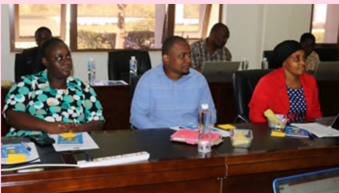
Washiriki wa Mafunzo ya Kamati ya Ukaguzi wa Ndani ya TSC wakivwa kwenye mafunzo.