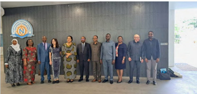
Waziri wa Nchi Ofisi ya Rais Tawala za Mikoa na Serikali za Mitaa (OR – TAMISEMI), Mhe. Angellah Jasmine Kairuki (wa tano kutoka kushoto) akiwa katika picha ya pamoja na timu ya wataalamu wa elimu katika shule ya Msingi Noorthshore nchini Singapore wakati wa ziara yake nchini hapo iliyofanyika tarehe 24 – 29 Julai, 2023.