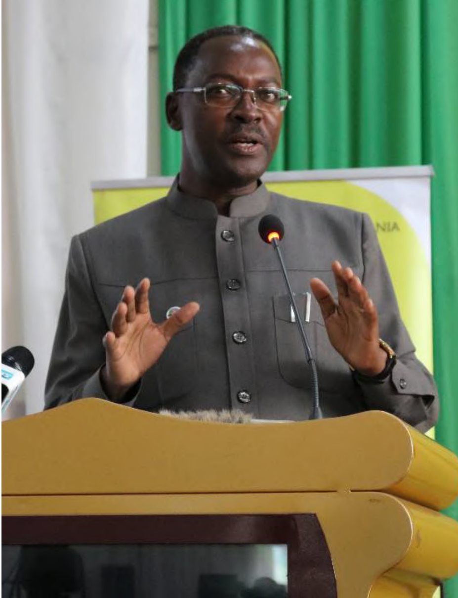
Waziri wa Nchi, Ofisi ya Rais Menejimenti ya Utumishi wa Umma na Utawala Bora, Mhe. George Simbachawene